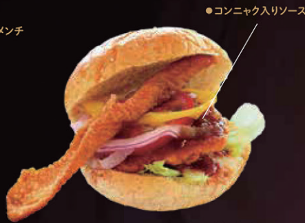
デビルズタンバーガー by あづま養魚場 【東吾妻町】

元祖デビルズタンバーガー。やまと豚のメンチカツを使用。やまと豚の上品なあぶらとこんにやくがベストマッチ。ブラッシュアップを何度も重ねている。元祖を置くだけあり、ペーコンもきれいな形に成形されている。【パンズ】日野製パン / 【こんにやく】小山こんにやく