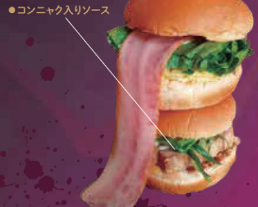
デビルズタンバーガー by 喜多方ラーメン cafe さくろ 【館林市】

メンチカツ・ハムカツ・コロッケの3種類。就労継続支援B型を利用して居る障がい者の皆様の手作りバーガー。あにまーとでは、OEMも請け負っている。参入を考えている店舗様は、是非ご相談を。【パンズ】パン工房あにまーと / 【こんにやく】小山こんにやく