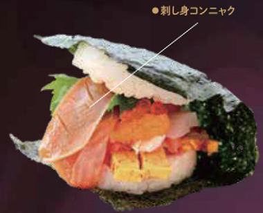
デビルズタンバーガー by さかえ鮨 【東吾妻町】

独自ブランドの群馬の最高級ニジマスであるギンヒカリの、トロと中落ちのタタキをぜいたくに使った魚肉のバテ。カルシウムや鉄分が豊富に含まれており、EPAやDHAも多い。味の決め手となるソースの中に自家製手作りコンニャクを使用。まさに『究極の健康魚』と言えるでしょう。【パンズ】町外のパン屋 / 【こんにやく】自家製