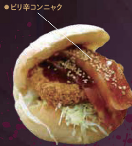
デビルズタンバーガー by パン工房あにまーと 【東吾妻町】

上州牛100%のバティなど8種類の具材を、こんにやくを練り込んだパンズで挟んでいる。バティは好きなだけ重ねることができ、ボリューム満点。【パンズ】青木パン屋 / 【こんにやく】親族自家製