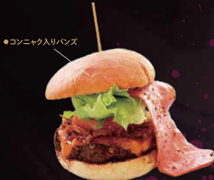
デビルズタンバーガー by カラオケ ジュピター 【東吾妻町】

創業60年。こだわり抜いた寿司シャリをパンにした寿司バーガー。東吾妻町産「シルクサーモン」や刺身こんにやく、豊富な海の幸を贅沢に使用。国産ウニのトッピングも出れます。数量限定で販売中。【パンズ】許飯 / 【こんにやく】小山こんにやく